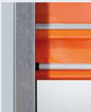
Алюминиевые профили, стабилизирующие завесу ворот