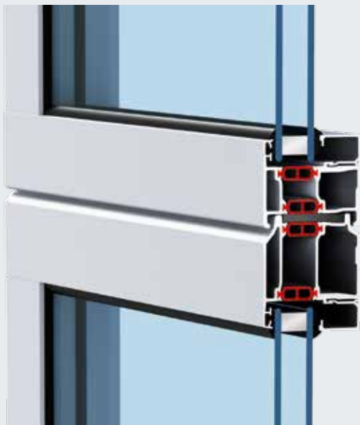
ALR 67 Thermo Glazing с алюминиевыми профилями с термическим разделением

Остекление ALR 67 Thermo Glazing идеально подходит для отапливаемых торговых залов. Алюминиевые профили с термическим разделением обеспечивают оптимальную теплоизоляцию при большом проникновении света. Показатель теплоизоляции на ALR 67 Thermo Glazing с опциональным климатическим остеклением и ThermoFrame может достигать до 1,7 Вт/(м 2 ·К). Благодаря этому Вы можете экономить расходы на отопление.